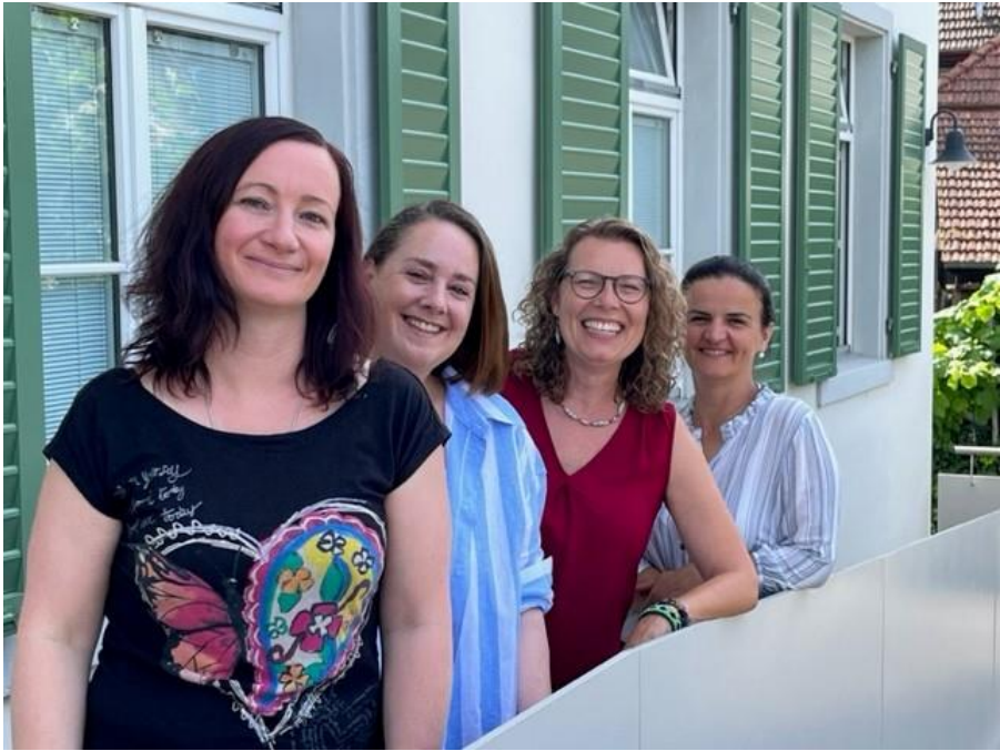
Urdorf 2024 J. Purkert-Karoulis