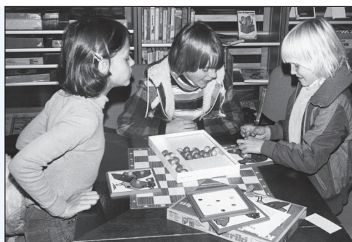
Spielen in der Bibliothek

«Lebhafter Betrieb an den Nachmittagen – Mütter mit Vorschulkindern nutzen die Bibliothek als Ausflugsziel. Werden die Kinder dann selbständige Leser in der Bibliothek, <vergessen> die Mütter oftmals den Weg in die Bibi.» ... «Immer wieder stellt sich die Frage aufs Neue, wie man neue Benutzerkreise anwerben könnte. Das Unterhaltungsbedürfnis scheint das Fernsehen weitaus bequemer zu stillen. Wir bemühen uns daher, die Bibliothek im Bewusstsein der Bevölkerung zu verankern als Ort, wo vielfältige Dokumentation und Information erhältlich ist.» (1987)